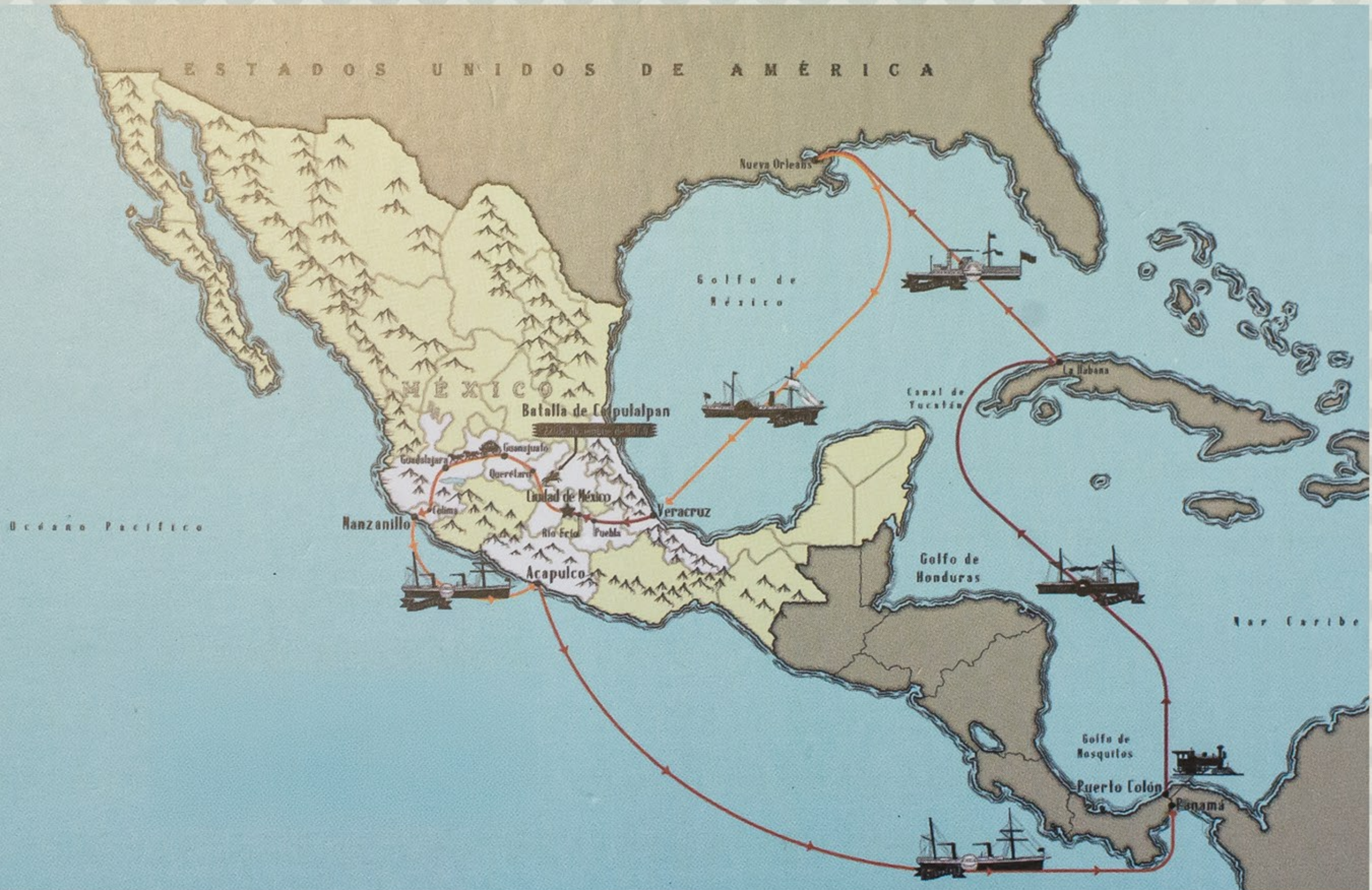
Una larga travesía | Ruta que realizó Benito Juárez y sus ministros de Manzanillo a Panamá

CASA BENITO JUÁREZ Veracruz, Veracruz, México