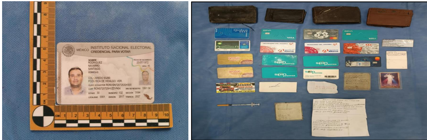
Indicios recuperados en la fosa “Palma Sola”

Como resultado de exhaustivas diligencias llevadas a cabo por la trilogía investigadora y a partir de los indicios encontrados en el inmueble asegurado en la localidad de Palma Sola, municipio de Coatzintla, se informa que fueron localizadas identificaciones y documentos pertenecientes a las víctimas.