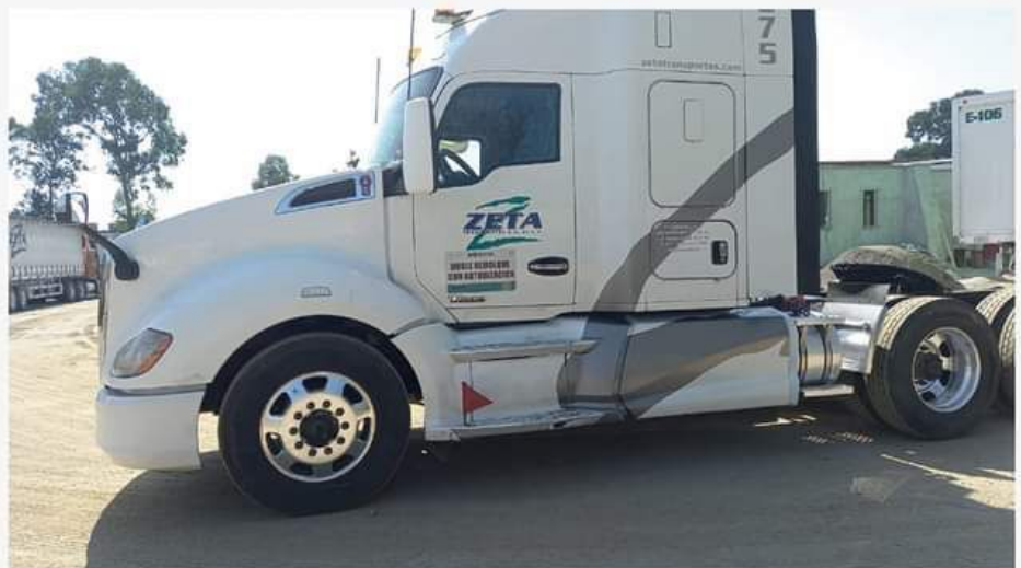
Tractor original de la moral representada.